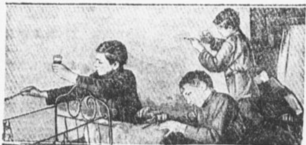
За работой по очистке квартир.