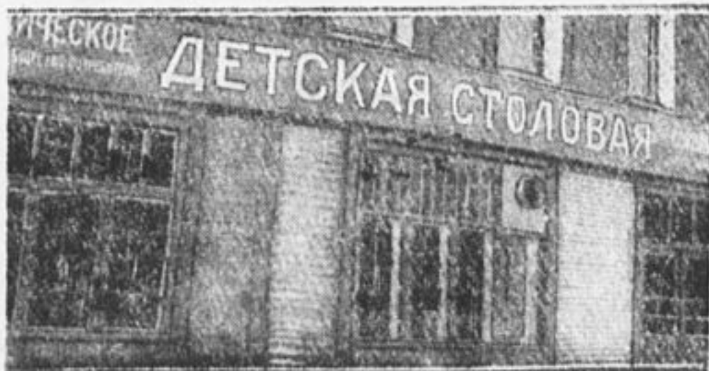
Тут ежедневно обедает 400 ребят.

Столовая ежедневно отпускает 400 обедов. Такое количество обедов совершенно недостаточно даже и для одного подрайона. Пионерам и школьникам надо позаботиться о своих младших товарищах и добиваться открытия специальных детских столовых в своих районах.