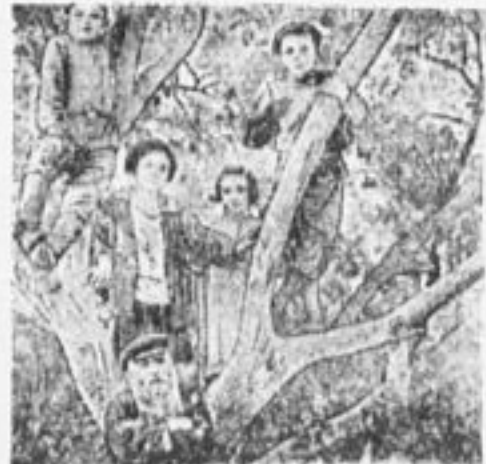
Дети евреев-земледелцев Крымской колонии.