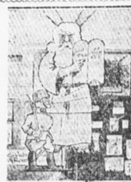
Антирелигиозный уголок в одном из немецких пионеротрядов.

* Когда я прочел в «П. П.» о «Барабане», я пошел к учителю и просил его агитировать за «Барабан». Учитель рассказал ребята о газете немецких пионеров. Шестая группа выписала три, а пятая — один экземпляр. Только седьмая группа не подписалась. Учитель общал один урок в неделю посвящать чтке газеты. В. Сержантов, латинская латинколла, Витеб. окр.