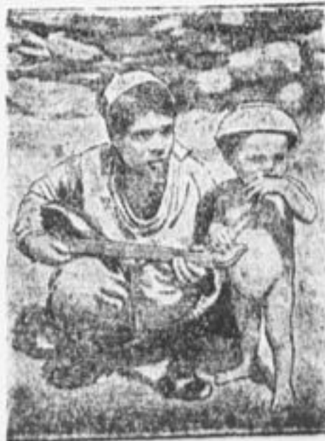
Ущелье в Лангаре.

1) Пик Кауфмана—высочайшая гора СССР (7.137 метров над уровнем моря).